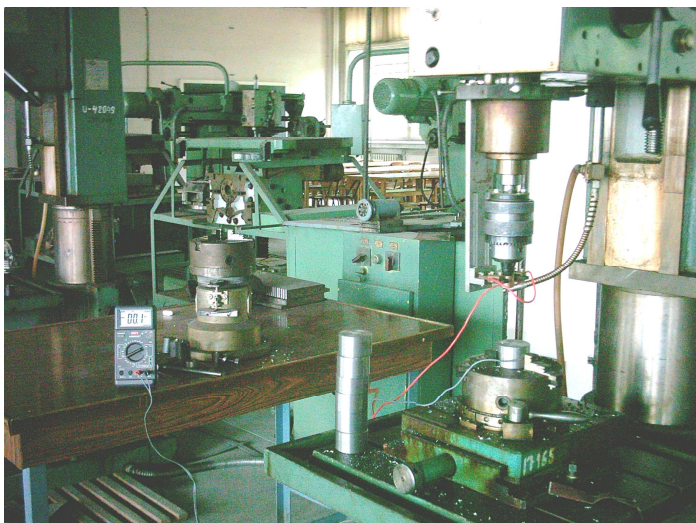
Figura 2. Instalație pentru măsurarea termocurentului de așchiere la burghiere Figure 2. Installation for measuring the cutting thermocurrent at drilling

Using the installation from figure 2 was obtained the dates from table 4 where it can be seen the efficiency of using the cutting fluid (emulsion), at different cutting speeds, by measuring the tension of the cutting thermocurrent.